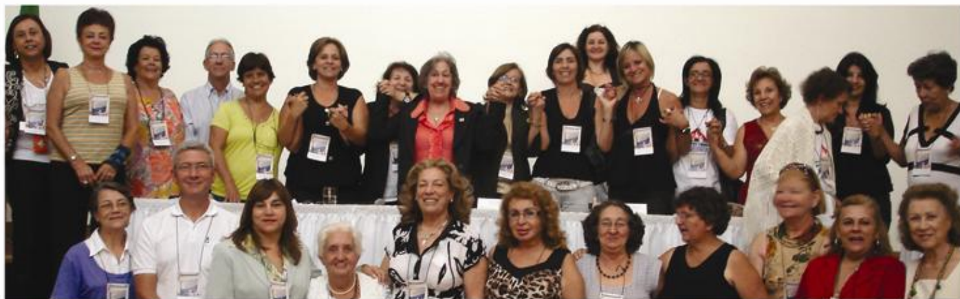
Lideranças do terceiro setor reunidas no 1º Seminário Mineiro de Entidades Civis de Proteção e Defesa dos Direitos do Consumidor, realizado neste mês, em Belo Horizonte.

I SEMINÁRIO ESTADUAL DE ENTIDADES CIVIS DE PROTEÇÃO E DEFESA DO DIREITO DO CONSUMIDOR REUNE LIDERANÇAS EM BH.